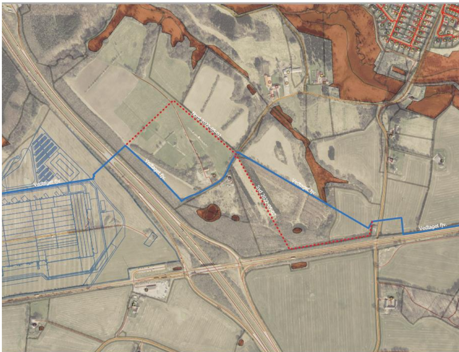
Kort 3. Ønskede ændringer i ledningsforløb i området øst for motorvejen, maj 2022. Kortet viser det oprindelige tracé med fuldt optrukket blå linje, mens de to foreslåede ændringer (nordlig og sydlig) er markeret med rød punkteret linje.